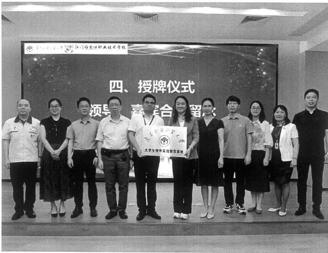
图 31 授牌仪式

为深入贯彻党的二十大精神，推进职普融通、产教融合，助力湾区教育高质量发展，4月23日上午，广东外语外贸大学与江门雅图仕职业技术学校结连理，举行“广东外语外贸大学大学生校外实践教育基地”签约授牌仪式，开启著名高校在侨乡共筑教育“高地”新篇章。