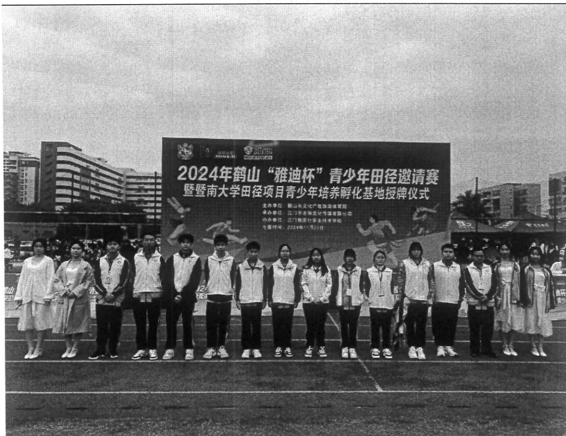
图 32 志愿者闪耀 2024 鹤山“雅迪杯”青少年田径邀请赛