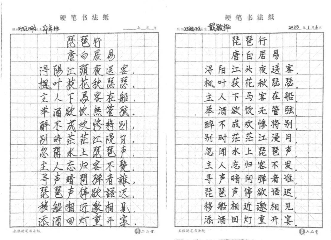
图 16 一纸一墨传承文化

学生心理健康问题成为学校、社会和家长高度关注的议题。本学年，心理健康教育工作以“精准评估-分层干预-品牌赋能-长效发展”为主线，构建了“筛查-教学-辅导-活动-协同”五位一体的工作体系。全