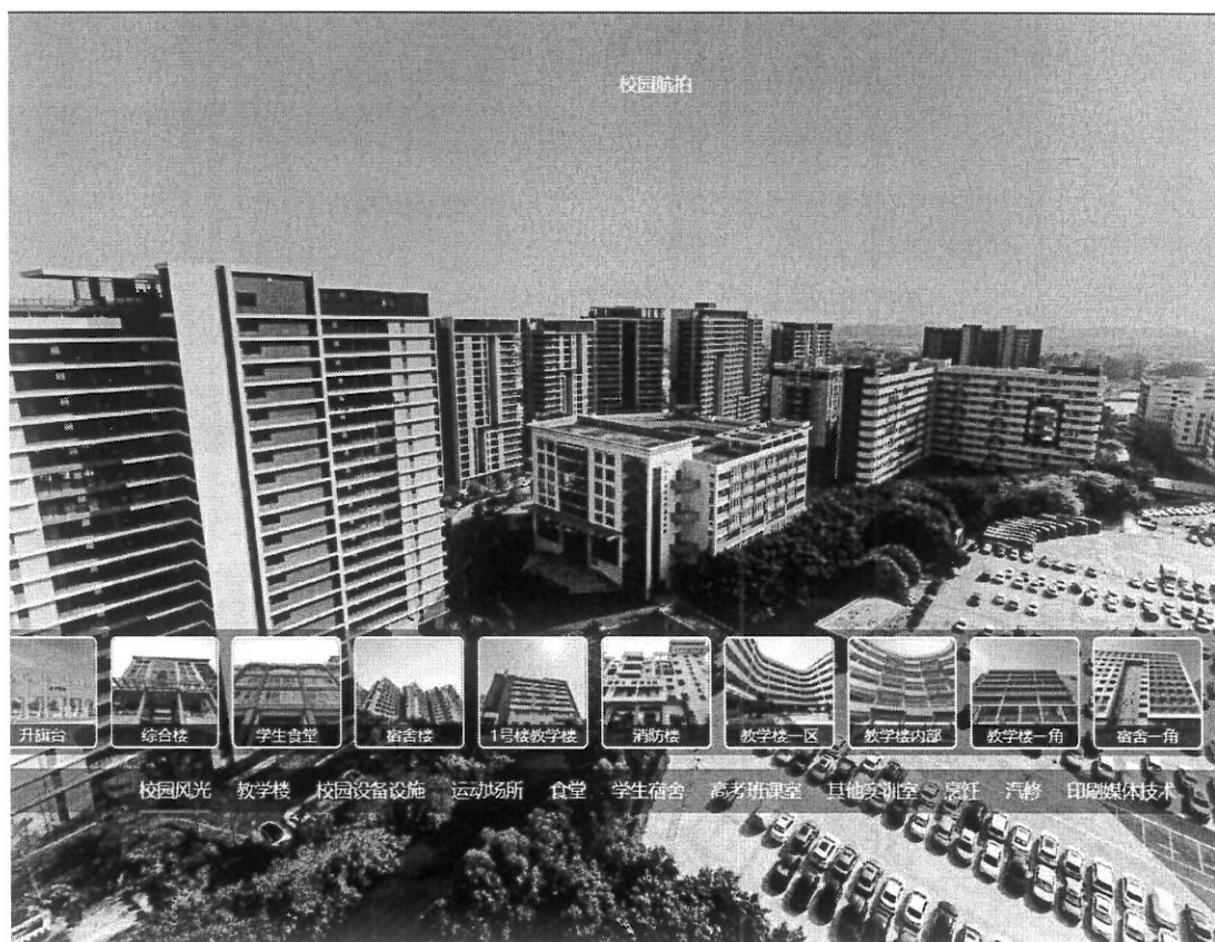
图 3 720 度 VR 校园全景