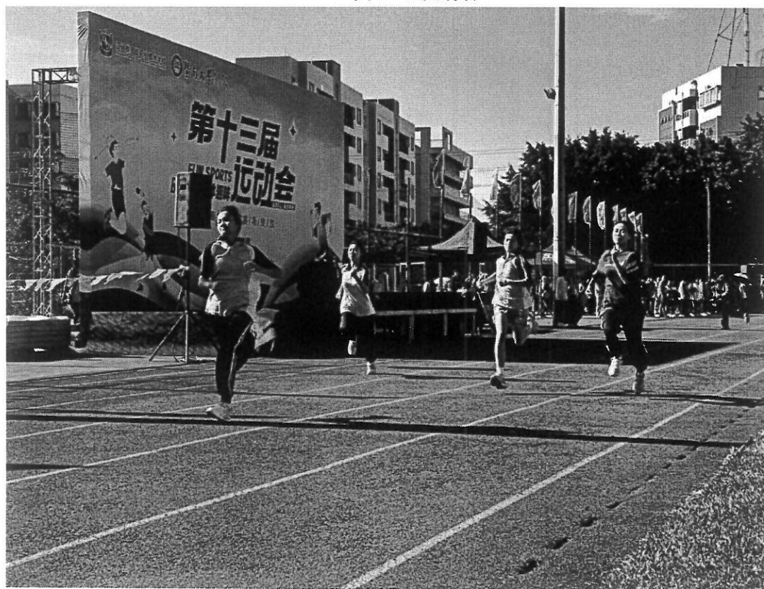
图 12 运动场上奔跑