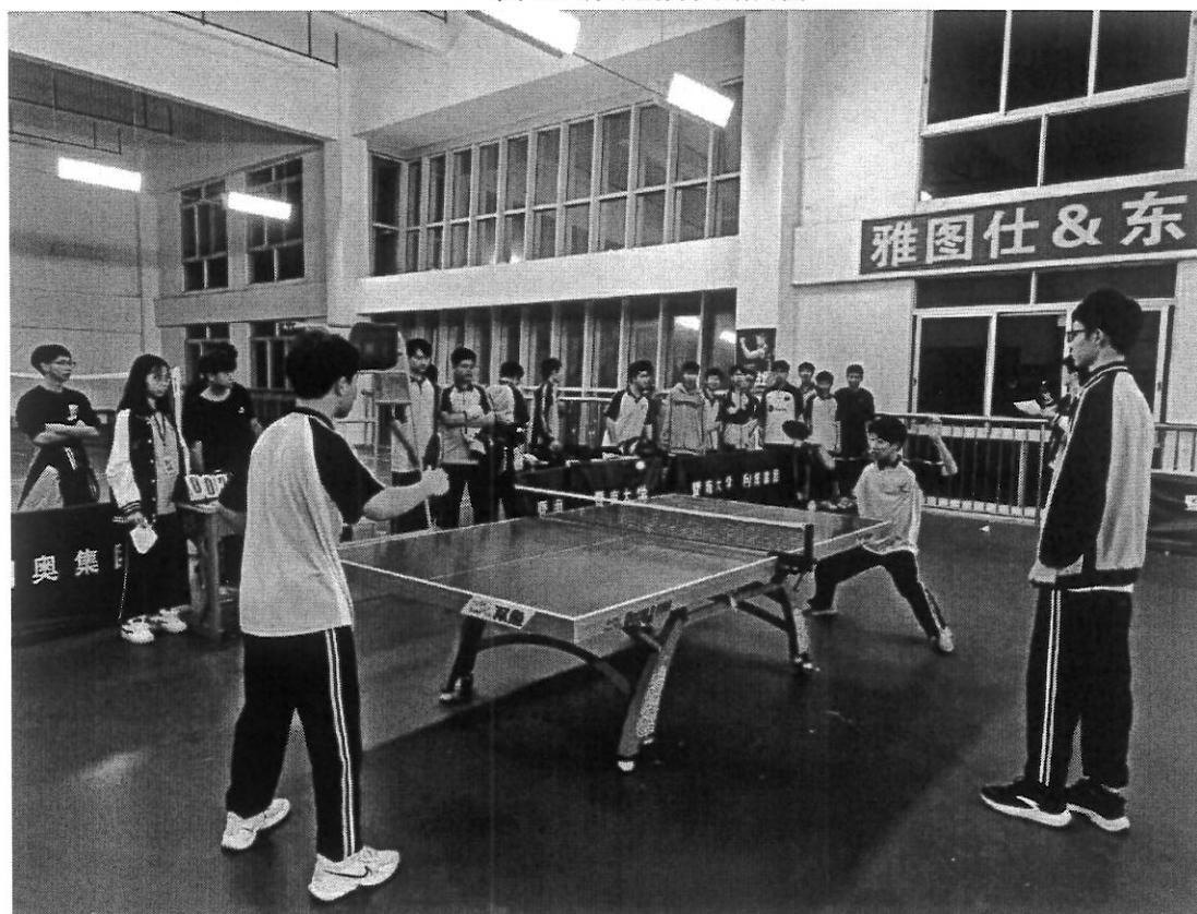
图 14 乒出未来