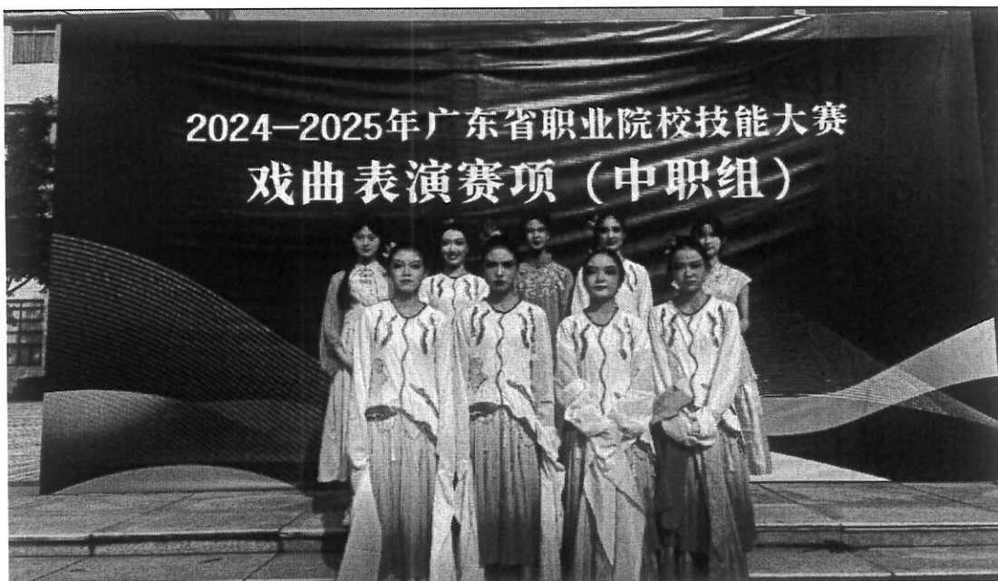
图 24 我校学子参加广东省技能大赛