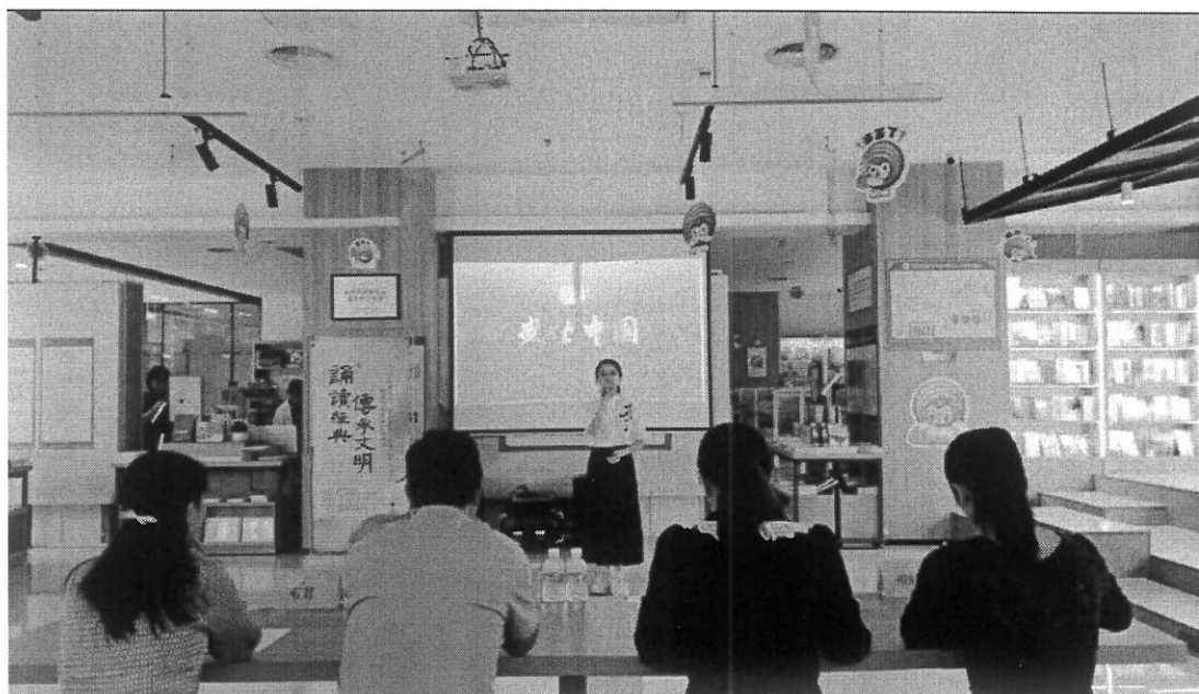
图 11 经典诵读