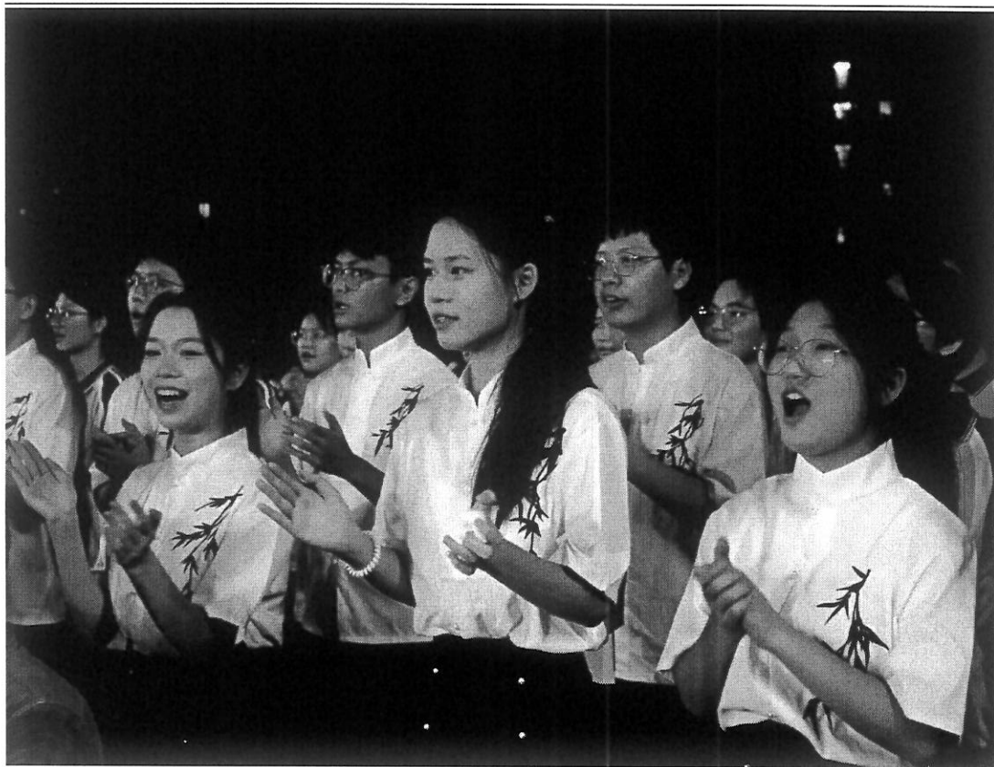
图7 雅校学子现场上演《盛世中国》节目朗诵