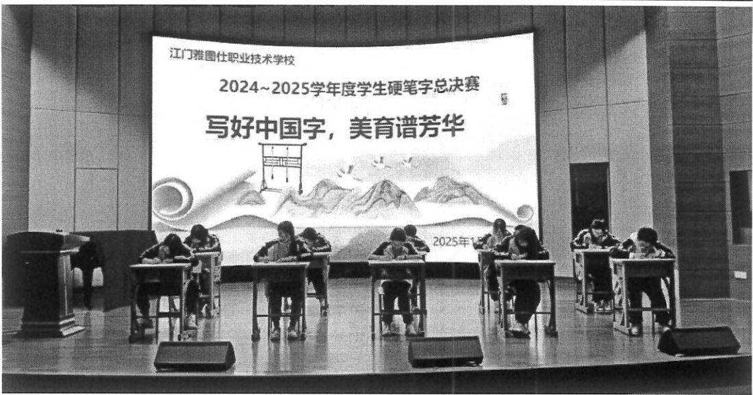
图 15 一笔一划书写青春