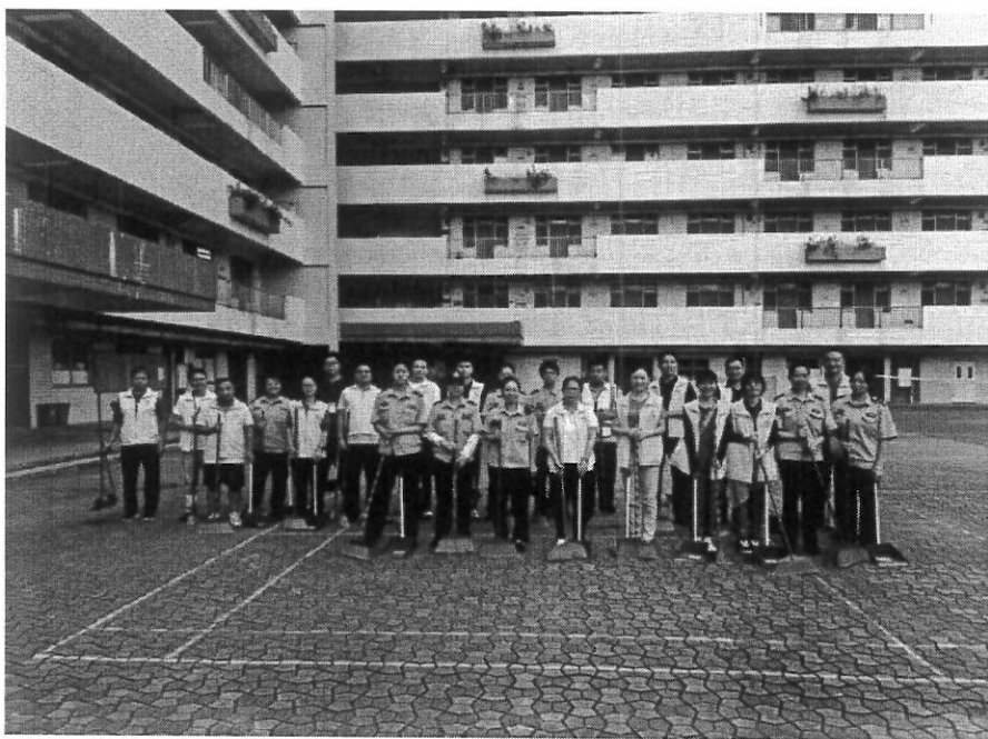
图 33 基孔肯雅热疫情期间的爱国卫生运动

学校充分发挥党员的先锋模范作用,带领全校师生为学校的发展和建设作出贡献。党员教师在教学、科研、管理等方面发挥了骨干作用,学生党员在学习、生活、社会实践等方面发挥了模范带头作用。