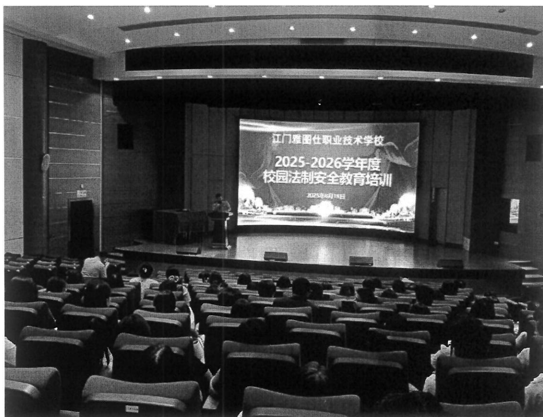
图 23 校园法制安全教育培训