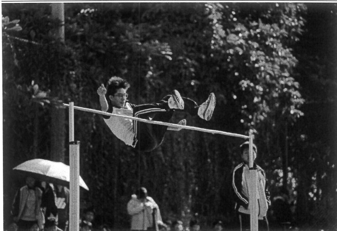
图 13 拼尽全力突破自我