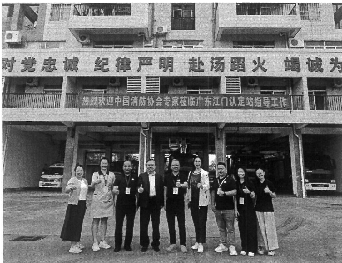
图2 消防安全管理员职业等级广东江门认定站顺利通过专家验收