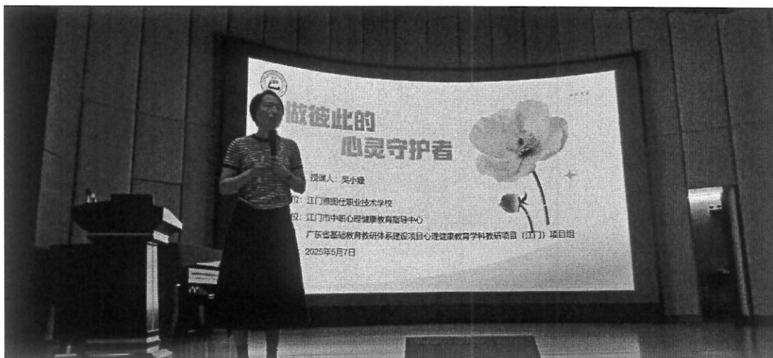
图 20 做彼此的心灵守护者