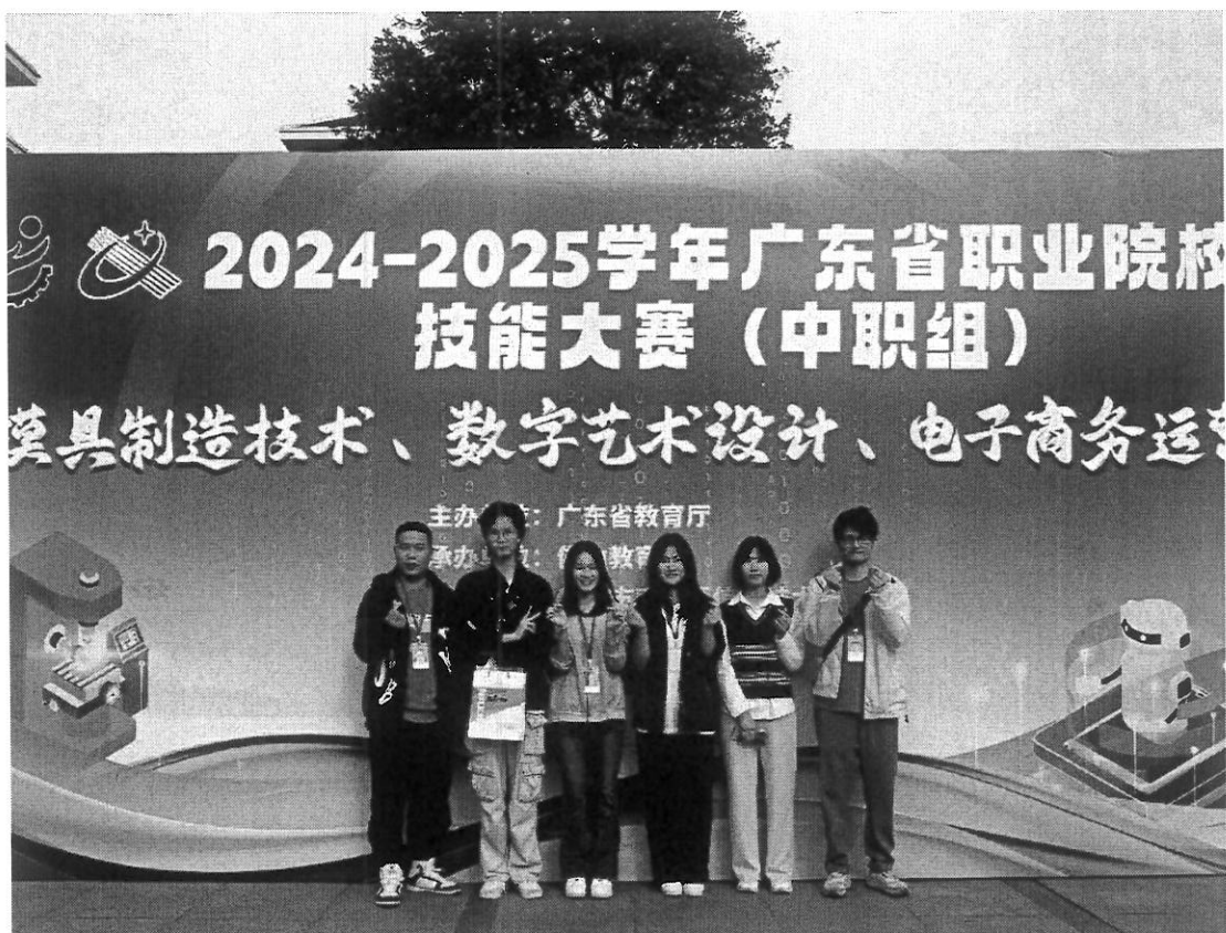
图 27 省赛剪影

2025 年 3 月 11 日，广东省职业院校技能大赛（中职组）在佛山市南海区南海信息技术学校正式拉开帷幕。我校队伍经过江门市竞赛的层层选拔，获得参赛资格。通过与全省职业院校学子同台竞技，展现专业技能风采，深化校际交流合作。