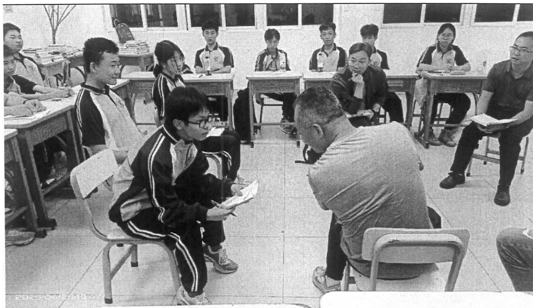
图 18 沟通之门心桥对话