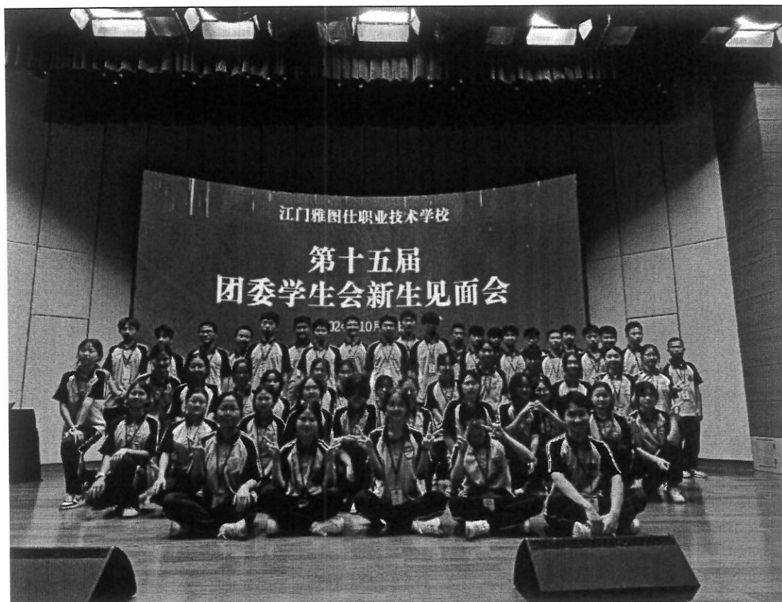
图4 学生会新生见面会