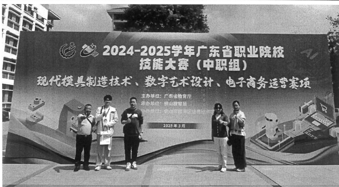
图 28 省赛留影