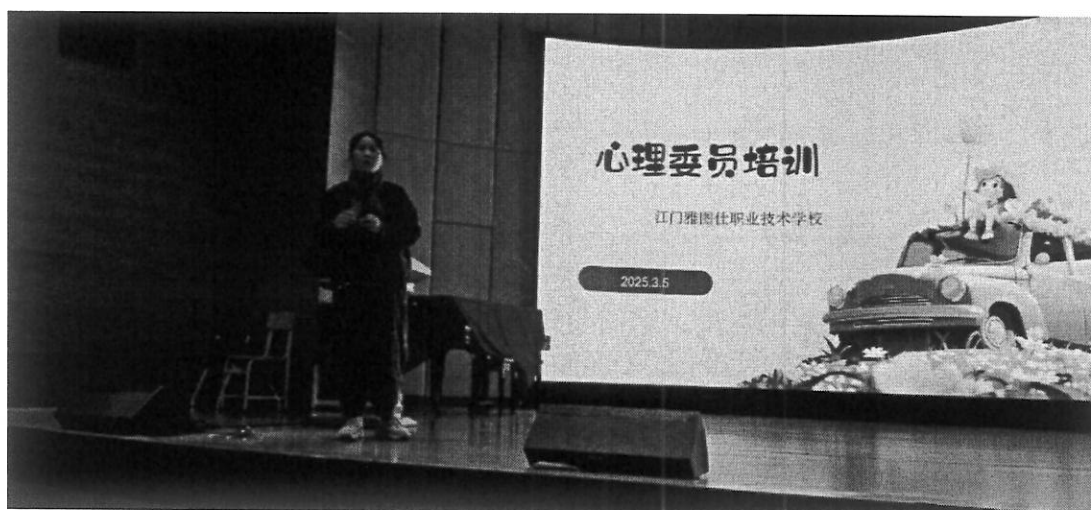
图 17 心理委员培训

规范化发展。4月28日晚，24级33班以“沟通之门心桥对话”为主题开展亲子叙事活动，通过“小记者采访大英雄”的创新形式，融合专业心理技术，让学生、家长在全员参与共创中重构家庭故事，搭建起理解与共情的桥梁，活动尾声心理教练还为现场及未能到场的家长赋能。4月30日，高二年级面向23级21班全体师生举办“携手同行，共筑梦想”非凡人生励志分享会，三位来自鹤山雅图仕印刷有限公司“爱心工厂”的特殊群体代表，以自身突破身体局限追逐梦想的真实经历，为师生带来了一堂鲜活的生命教育课，传递了“尊重差异、共筑未来”的校园文化精神。5月7日，学校心理健康发展中心特邀江门市中职心理健康教育指导中心主任吴小姗开展《做彼此的心灵守护者》主题讲座，200余名师生在心理学理论与互动体验中提升心理互助能力，学校也将借此开通线上心理辅导预约通道，全方位为学生心灵成长保驾护航。这些活动从朋辈互助、亲子沟通、生命教育、师生赋能等多维度发力，为构建积极健康的校园环境注入了强大动力。