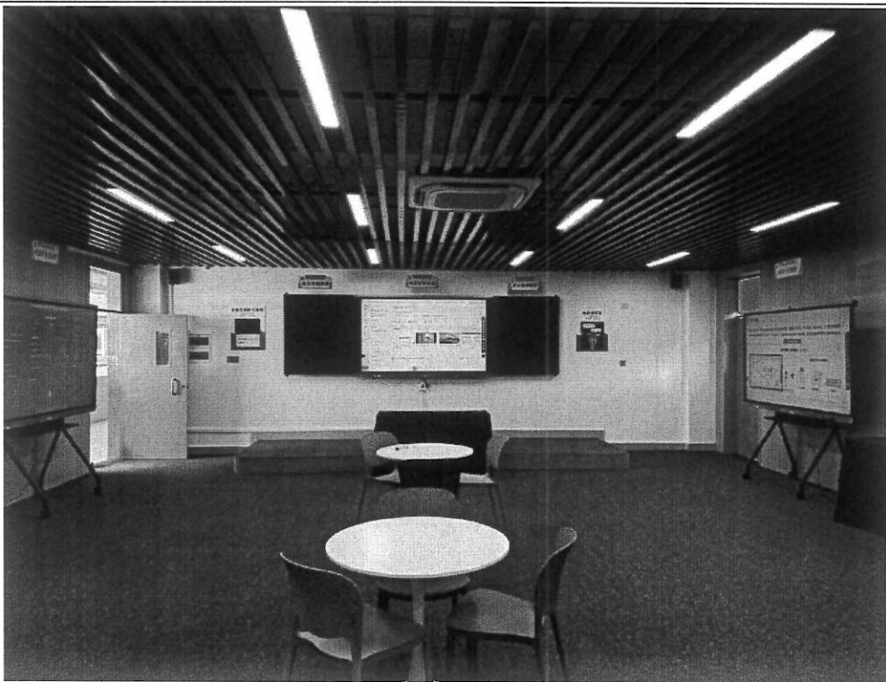
图 29 科大讯飞展厅