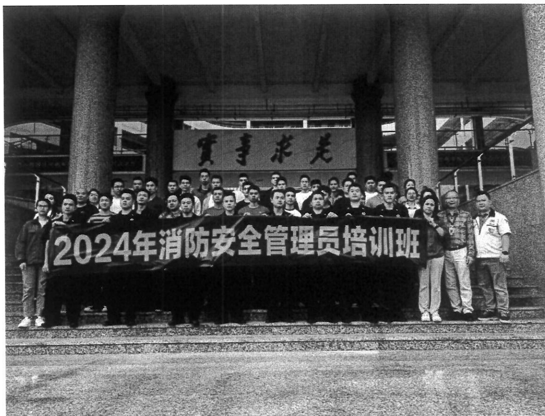
图 30 消防安全管理员顺利毕业

期盼下，退伍军人消防管理员培训班隆重开幕。该培训班旨在为退伍军人开辟新的职业道路，并为消防安全领域输送充满活力和专业知识的新鲜血液。此次培训，无疑为退伍军人开辟了一条新的职业发展道路，让他们能够在离开部队后，凭借所学在消防安全领域继续发光发热。同时，这也为我们的消防安全事业注入了一股新的、充满活力的力量。这些优秀的退伍军人在未来的工作中，必将充分发挥在本次培训班所学的知识与技能，以他们高度的责任感、严谨的工作态度以及过硬的专业素养，为保障人民生命财产安全全力以赴，在消防安全的战线上续写属于他们的辉煌篇章。