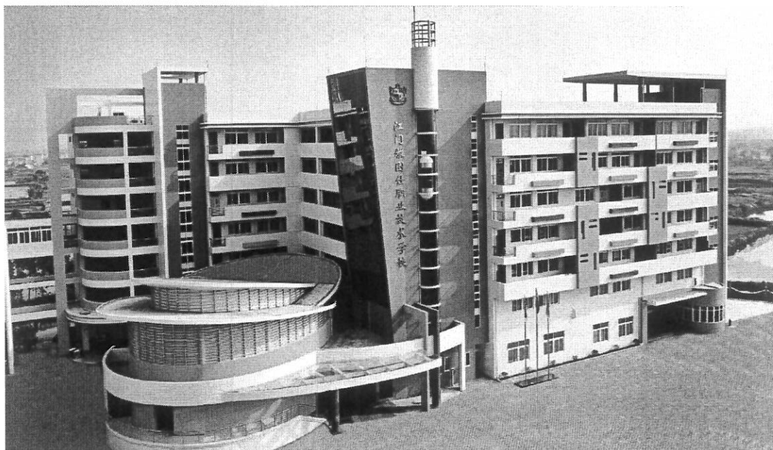
图 1 学校一号教学楼全景图

江门雅图仕职业技术学校由香港利奥集团下属鹤山雅图仕印刷有限公司于 2010 年全资兴办，是经江门市教育局和江门市民政局批准的、广东省教育厅备案的综合性省级重点建设中等职业学校。践行“以德为先，求实创新，知行合一，臻善至美”的价值观。