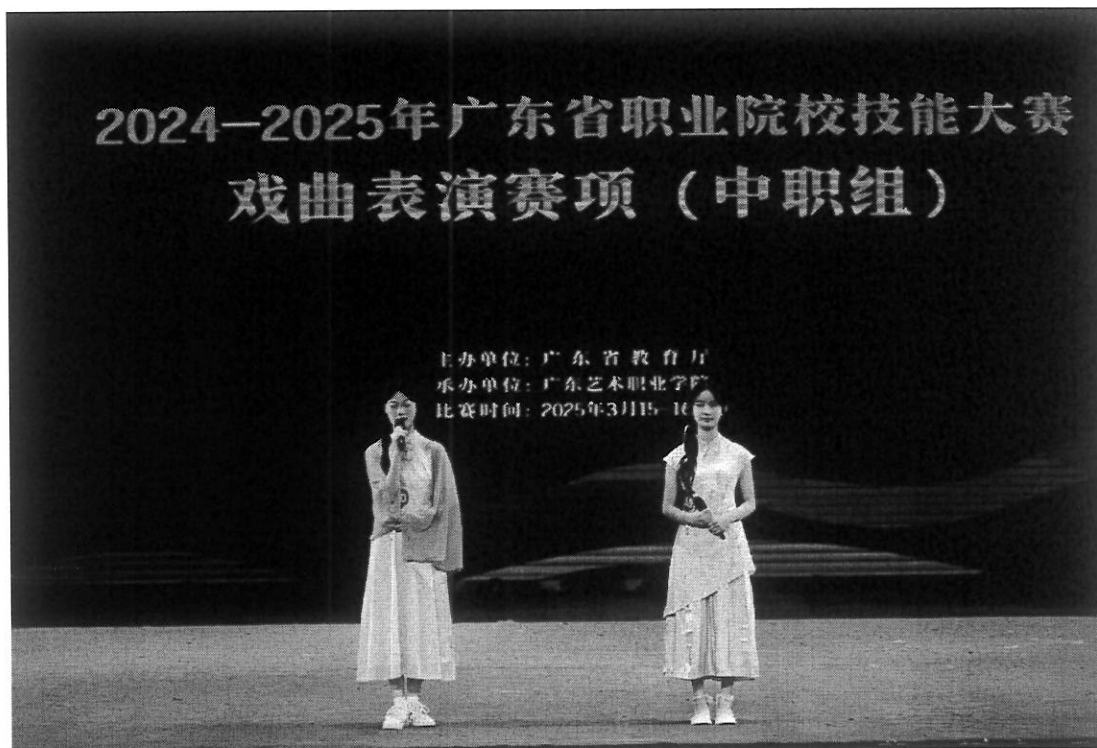
图 25 以市赛一等奖的荣耀代表江门市出征省赛