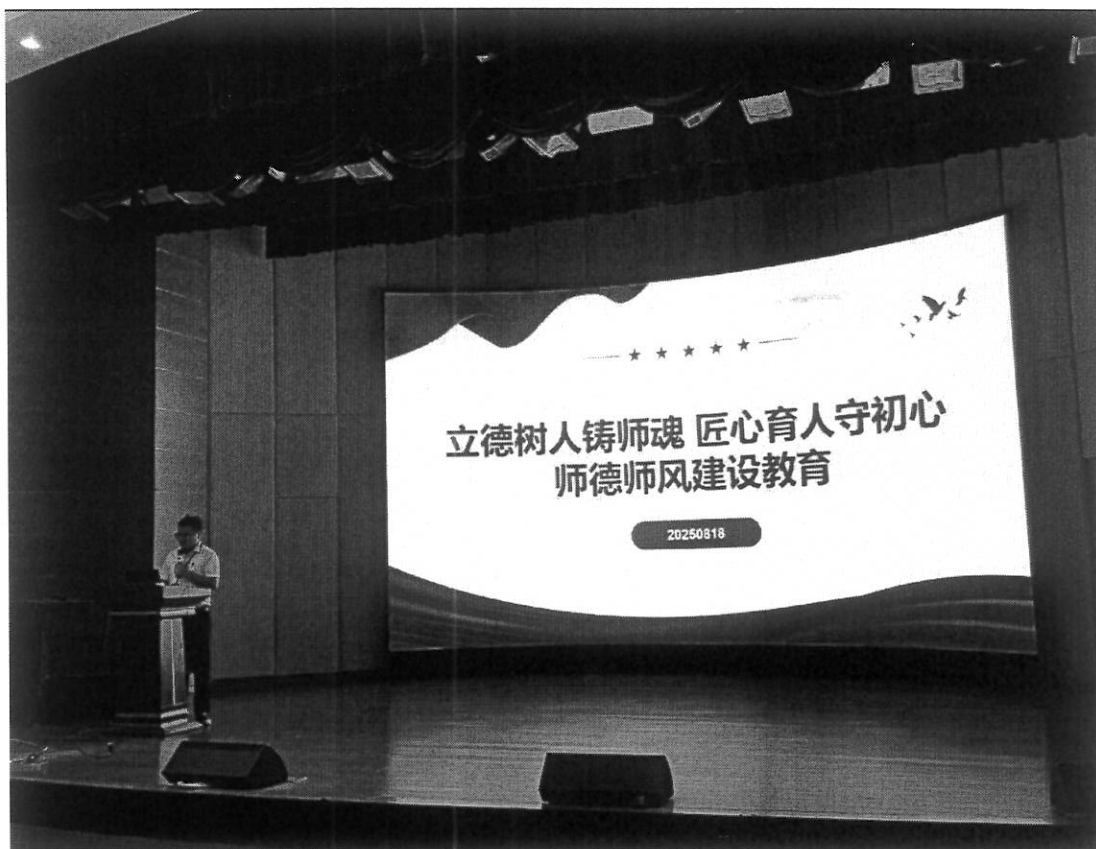
图 22 校本培训