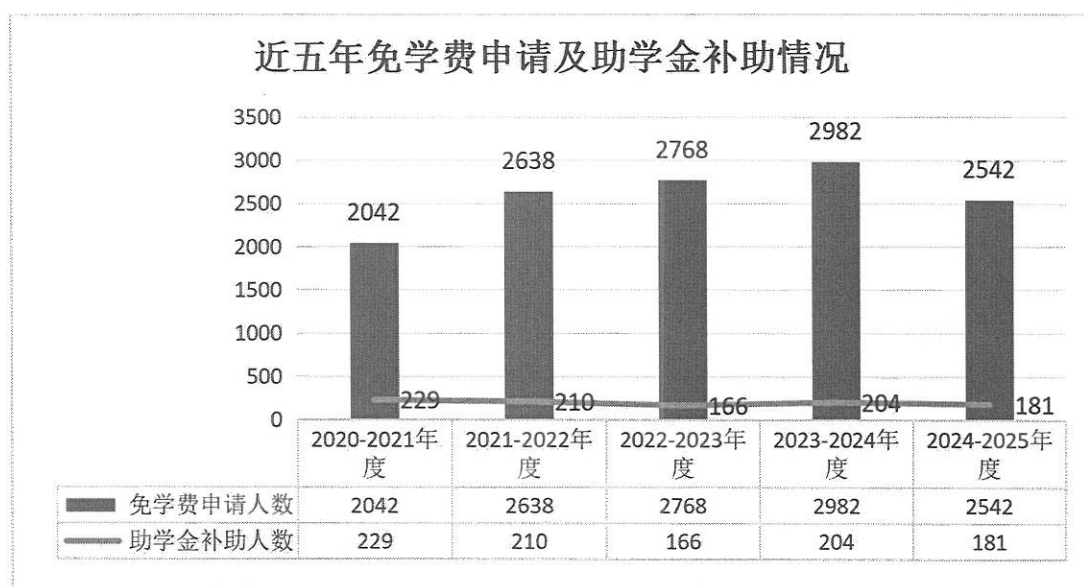
图 36 近五年免学费申请及助学金补助情况

2024-2025 学年雅图仕职业技术学校申请并符合免学费条件学生 2542 人,其中普通学生 2536 人,残疾学生 6 人,共计 846.08 万元,用于日常学校公用经费支出。2024-2025 学年国家助学金人数 181 人,已按要求补助至相关学生。