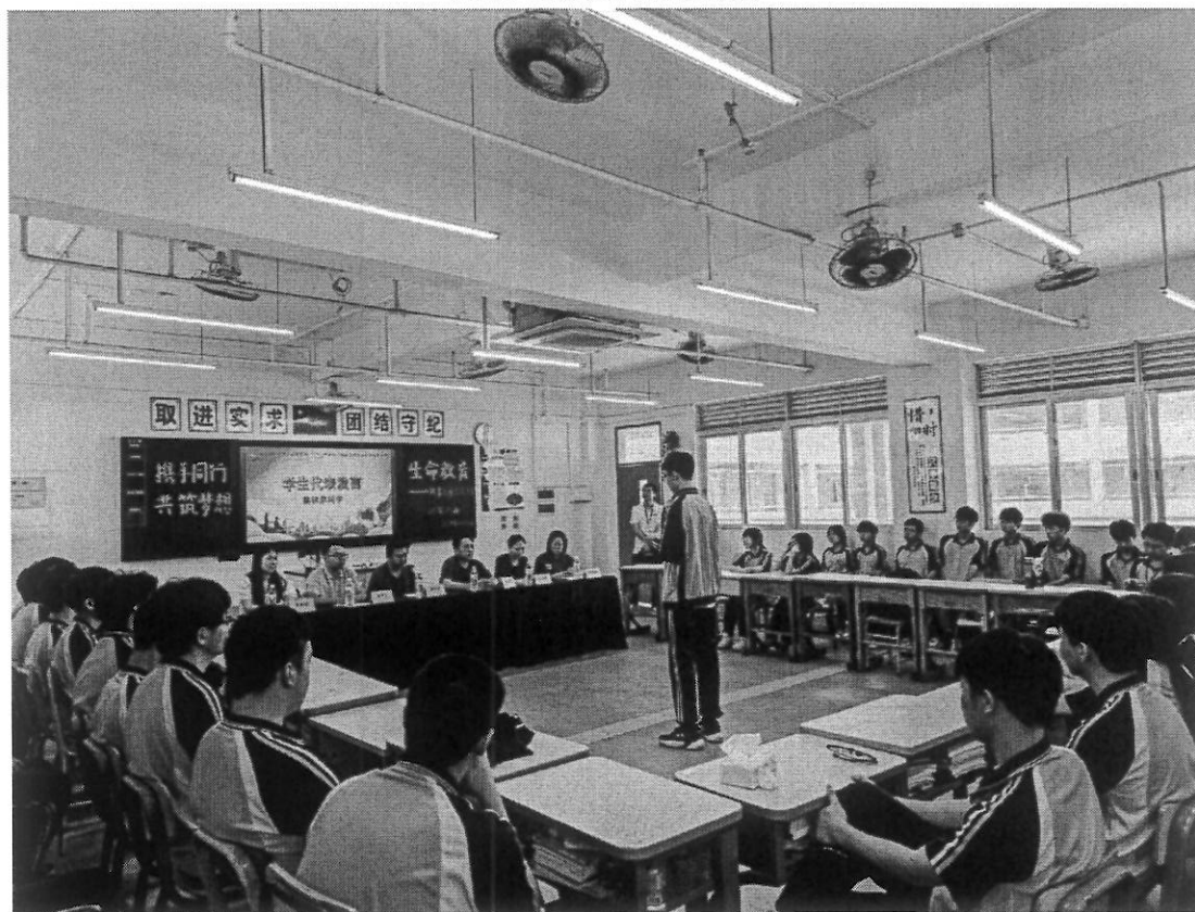
图 19 非凡人生励志分享会